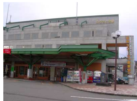
松代・松之山温泉観光案内所